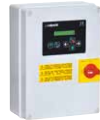
Coffret de commande QTL/A 2D

En complément de cette sélection de surpresseurs, de nombreux modèles sont également disponibles. Devis sur demande : devis@calpeda.fr