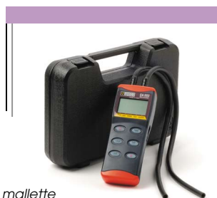
Livré en mallette avec ses accessoires