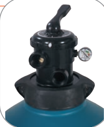
Vanne - Top