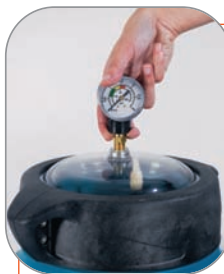
Collecteur - Latéral