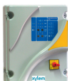
Coffret Ductor 2P-F