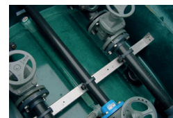
Intérieur du regard avec clapets et vannes