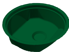
Fond de cuve avec cuvette pour installer un vide-cave

Xylem Water Solutions France SAS 29 rue du Port - Parc de l'Île 92022 Nanterre Cedex Tél. : 09 71 10 11 11 www.xylem.com/fr