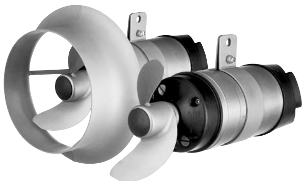
AGITATEURS SR 4610/4620 - ACIER INOXYDABLE AISI 316 L

Les nouveaux agitateurs série 4600 sont, dans le domaine de l'agitation, l'aboutissement de 15 années d'expérience dans la construction et la mise en œuvre du concept submersible.