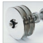
Turbines en acier inoxydable