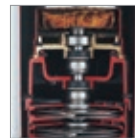
Double garniture mécanique