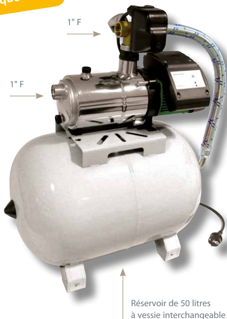
Réservoir de 50 litres à vessie interchangeable