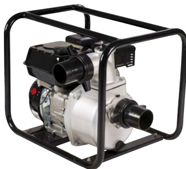
GP 50 / GP 80