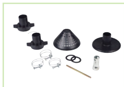
Accessoires livrés avec GP10