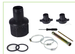
Accessoires livrés avec GP50 / GP80