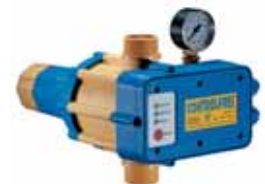
CONTROLPRES pour puissance jusqu'à 2,2 kW. Régulation de la pression de sortie entre 3 et 6,5 bars.