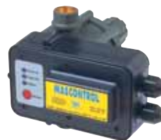
MASCONTROL pour puissance jusqu'à 2,2 kW