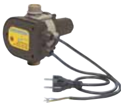
ECOCONTROL pour puissance jusqu'à 1,1 kW