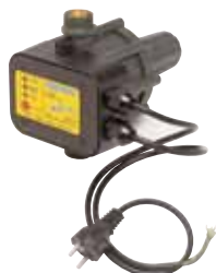
PRESSCONTROL PRESSCONTROL TIME pour puissance jusqu'à 1,5 kW