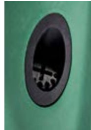
Refoulement avec insert laiton Ø 1"1/4