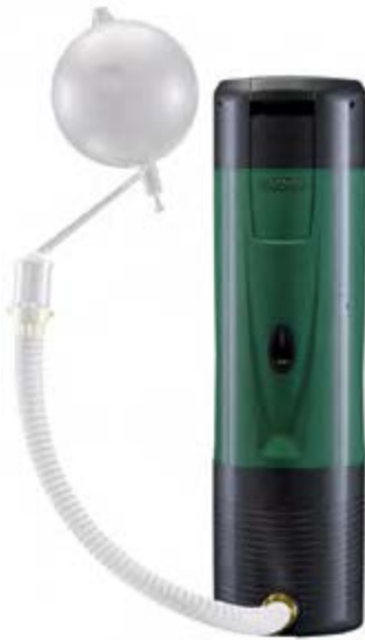
Valve de dégazage