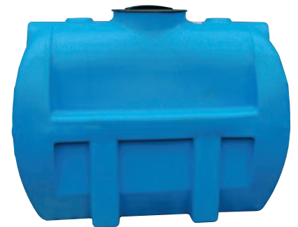
Réservoir horizontal : RS 1300