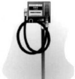
Installation sur colonne