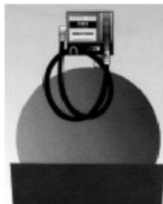
Installation directe sur citerne