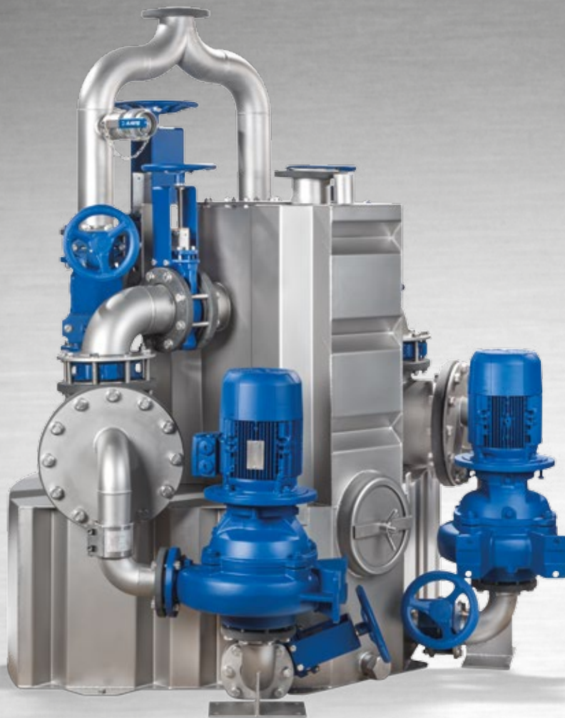
AmaDS 3 – compact