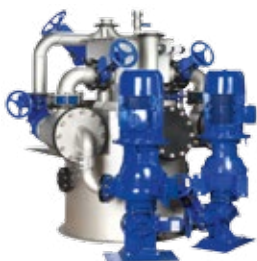
AmaDS 3 – circulaire

Pour plus d'informations : www.ksb.fr/produits