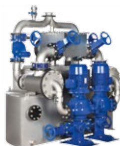
AmaDS 3 – semi-circulaire