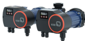
Calio Pro Z – Pompe double à orifices filetés