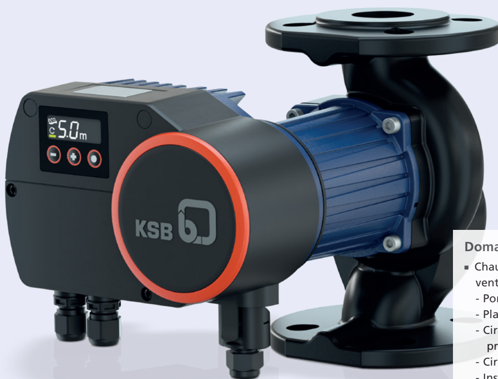
Calio Pro à brides