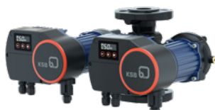
Calio Pro Z – Pompe double à brides