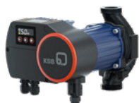
Calio Pro à orifices filetés

Pour plus d'informations : www.ksb.com/.fr-fr