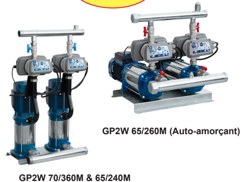
GP2W 65/260M (Auto-amorçant)