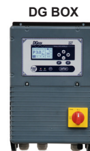
système de contrôle et protection avec variateur de vitesse.