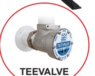
Clapet anti-retour avec détecteur de débit et capteur de pression intégrés