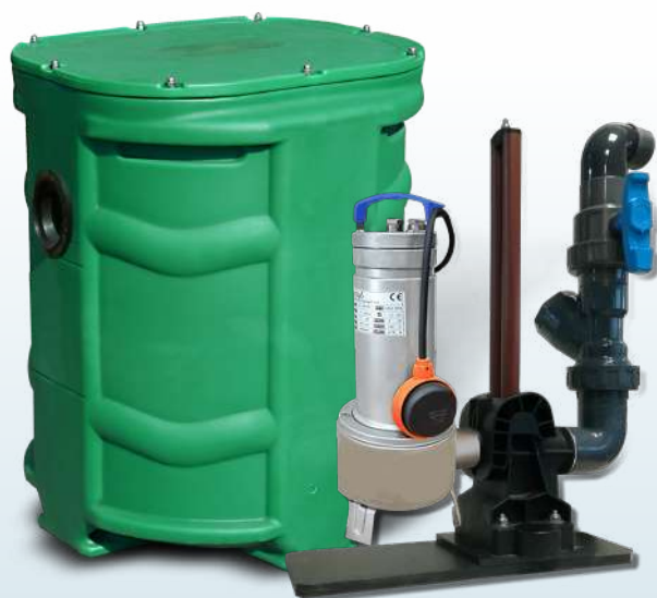
SANIREL 250 1 POMPE BARRES DE GUIDAGE