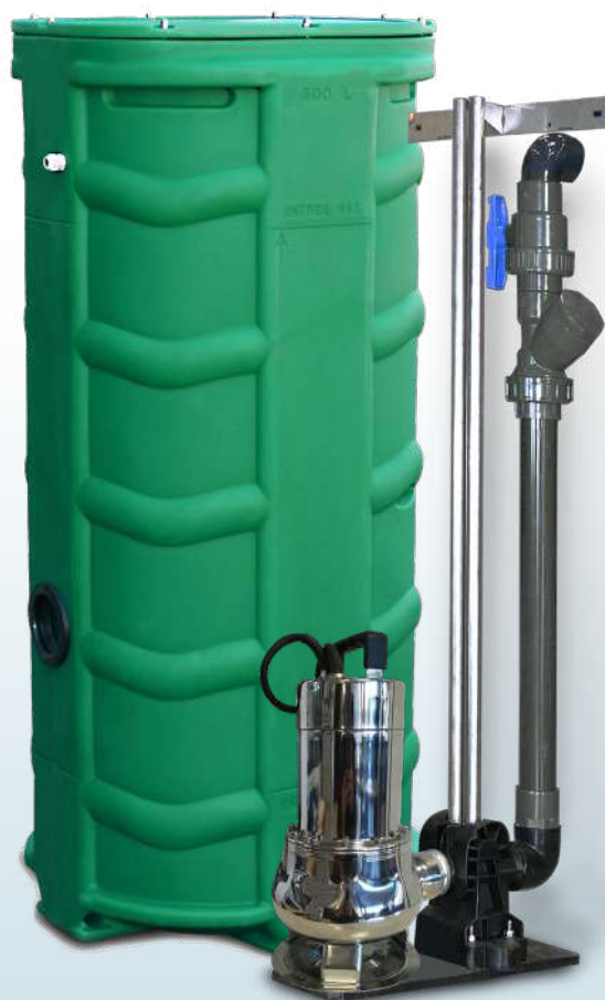
SANIREL 500V 1 POMPE BARRES DE GUIDAGE

STATIONS DE RELEVAGE • INDIVIDUELLES • EAUX CHARGÉES