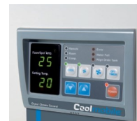
Minuteur et thermostat d'ambiance digital