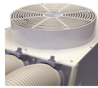
Sortie d'air chaud