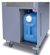
Bac de récupération des condensats