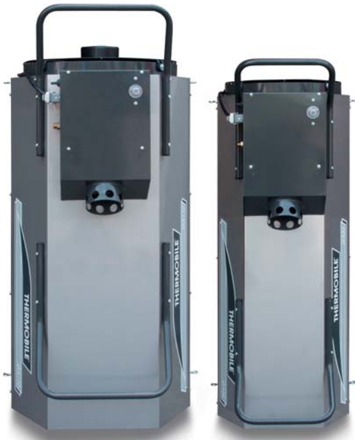
GA 110 EV