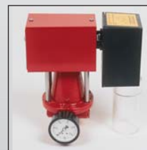
Servo moteur avec vanne gaz pour branchement sur ordinateur.

Le système plus petit MS 20, est livré comme régulateur séparé et détendeur à monter séparément avec un servomoteur. Sur ce système 1 à 3 appareils peuvent être branchés.