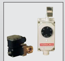
Système pour protection anti-incendie pour séchage des produits de récolte.