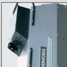
Panneau de contrôle comportant tous les composants sensibles à l'épreuve de l'humidité et de la poussière, avec prise extérieur d'air de combustion.