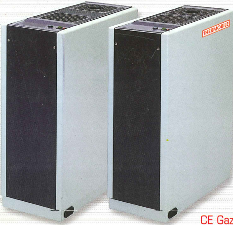
CE Gaz 51AT460