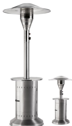
CALIPSO INOX PRO*