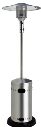
CALIPSO INOX CLASSIQUE (existe en version rétractable)