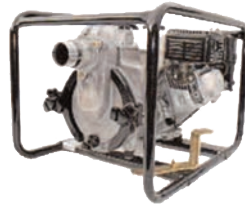
TED2 50 HA