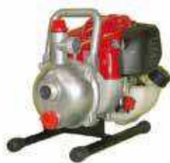
TEM 25 H