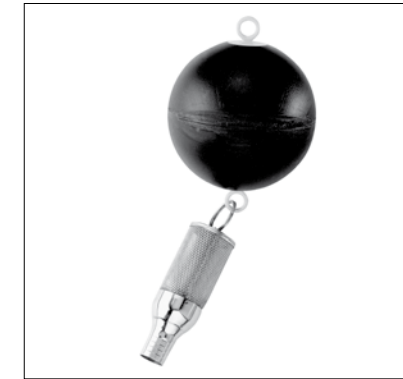
Filtre d'aspiration à flotteur à grosse maille GR

Application Tuyau d'aspiration/refoulement. -25 à 55 °C inclus deux douilles cannelées (R1" et R 1 1/4") pour le raccordement du filtre à flotteur.