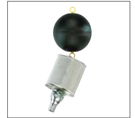
Filtre d'aspiration à flotteur à fine maille FR

Matériaux Flotteur : polyéthylène Filtre : acier inox