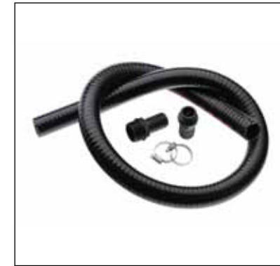
Tuyau d'aspiration 1 1/4" SE - PN 10

Application Tuyau d'aspiration/refoulement. -25 à 55 °C inclus deux douilles cannelées (R1" et R 1 1/4") pour le raccordement du filtre à flotteur.