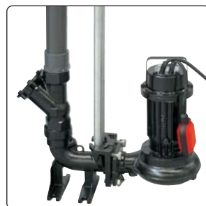
Exemple : CAL 230 - 75HMPA