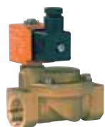
Electrovanne ESM 86 24 V ou 230 V