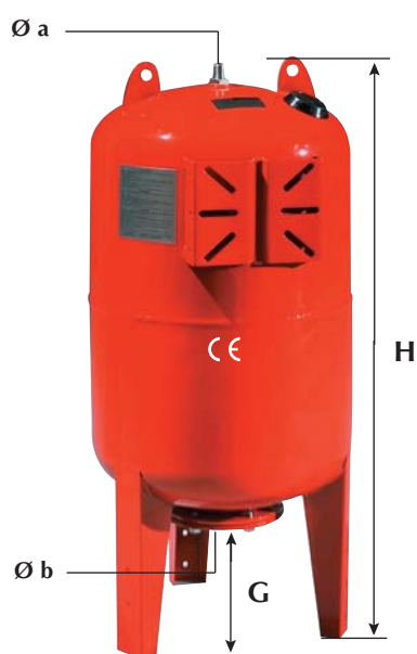
Type V : vertical