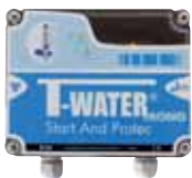
Coffret Mono SP