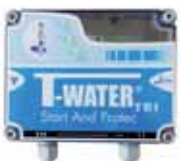
Coffret Tri SP