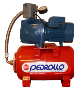
HYDROFRESH avec réservoir (livré monté et câblé)